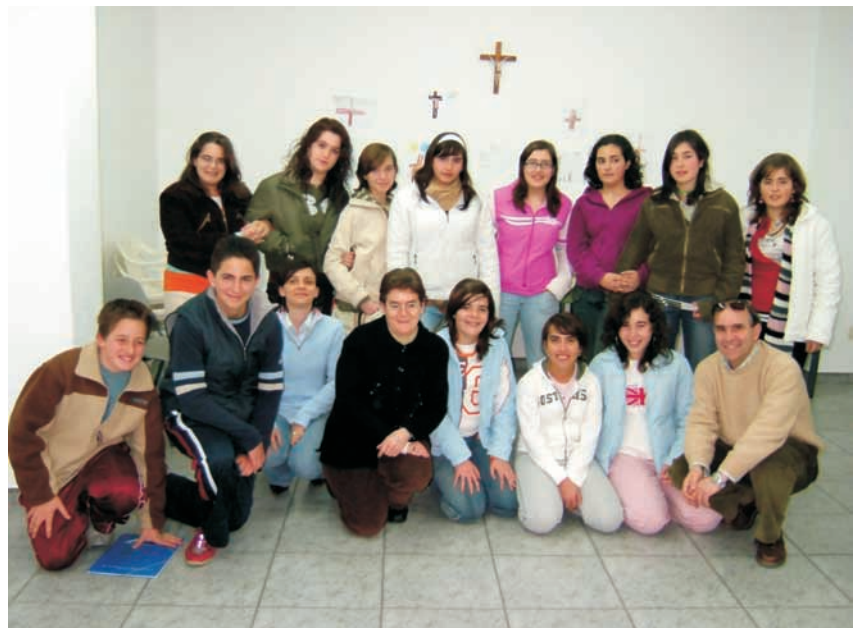
Los / as participantes en la convivencia

Gracias a todas las personas que han hecho posible esta convivencia y esperamos repetirla a final del curso