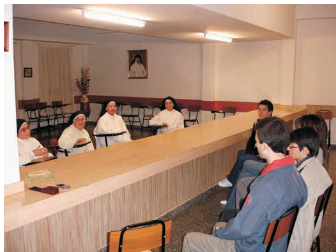
Monasterio de la Inmaculada