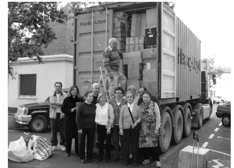
El grupo de Caritas echando una manita a los Magos de Oriente. Esperamos que pronto llegue este contenedor a nuestros hermanos de Lima.