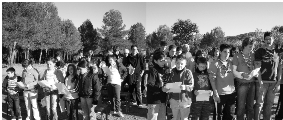
Los Juniors os invitamos a vivir estas fiestas siguiendo siempre a Jesús con lealtad y alegría.