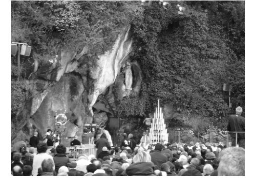
La luz que ilumina la oscuridad ha brillado en el recién nacido. Desde Lourdes, donde contemplamos esta luz, feliz Navidad especialmente a los enfermos de la parroquia.