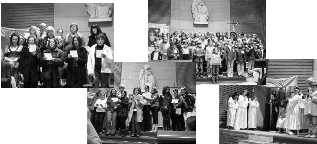
Los más pequeños estamos conociendo a Jesús. Nuestros padres y catequistas cantan con nosotros al niño Dios.